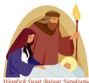
Wesołych Świąt Bożego Narodzenia